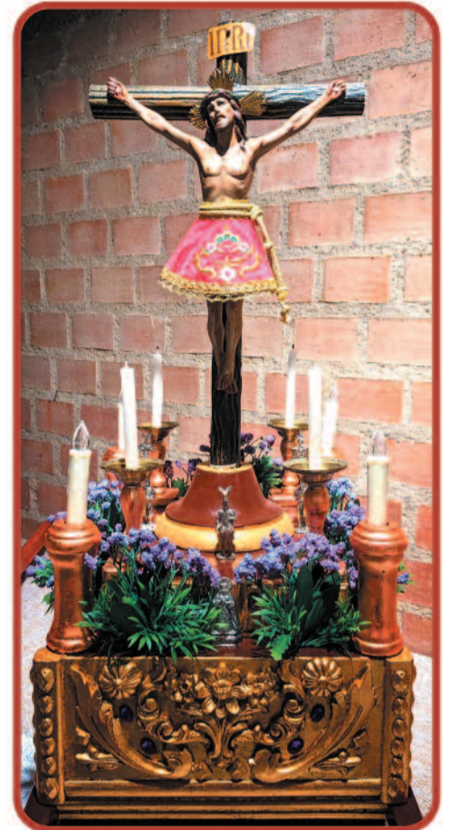
Exposición LA PASIÓN DEL SEÑOR Miniaturas de Enrique Delgado Muñoz Hasta el 7 de abril

Parroquia Santa María del Buen Aire Calle Encomienda de Palacios, 192 MORATALAZ - Madrid Autobús: 8 - 20 / Metro Línea 9: Artilleros - Pavones Horarios: Lunes a Viernes de 18:30 a 20:30 Sábados de 10:30 a 11:30 y de 18:30 a 20:30 Domingos de 9:30 a 13:30